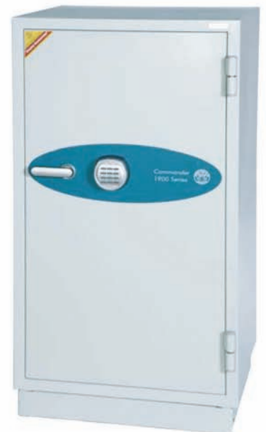
Fire Commander FS1901

Optionale Extras lieferbar Höhenverstellbare Fachböden Aufhängung für Hängeregister (nur bei FS1902 & FS1903) Fingerabdruckschloss Datenschutzzeinsatz (nur bei FS1902 & FS1903)