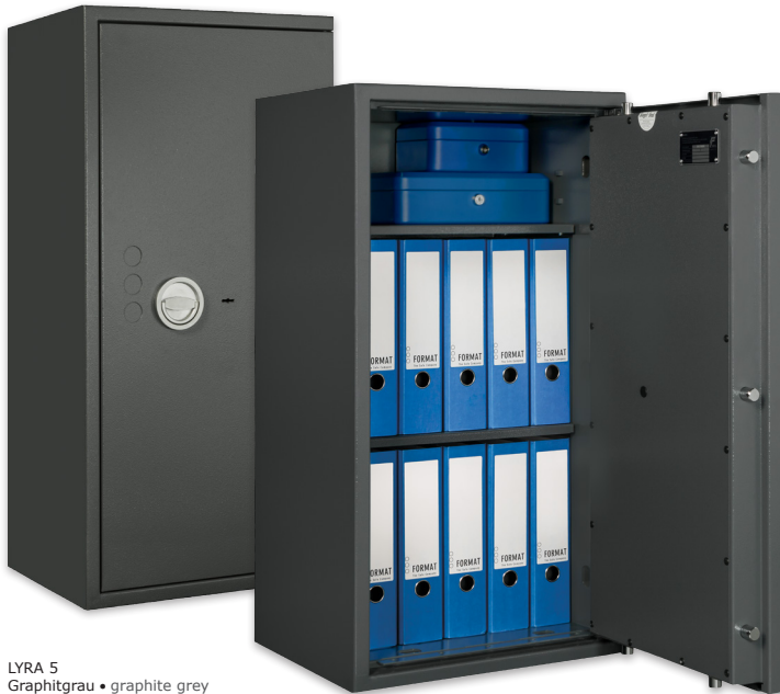
LYRA 5 Graphitgrau • graphite grey Dekoration nicht im Lieferumfang enthalten • decoration not included in the delivery