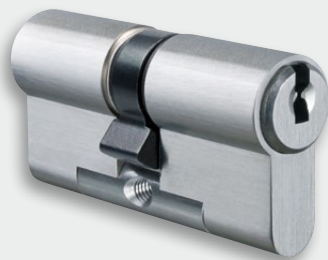
ICS-Doppelzylinder in Modulbauweise