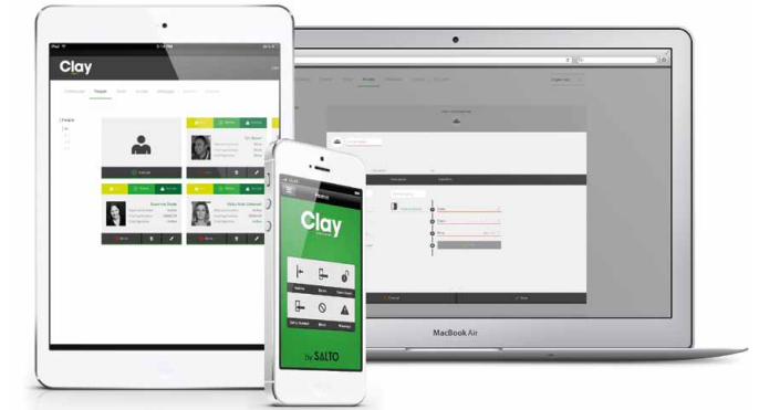
Zutrittsverwaltung via Online-Plattform und App

Komplett ohne Softwareinstallation lässt sich nach dem geschützten Log-in auf My-Clay.com das gesamte Zutrittsystem steuern und verwalten: z. B. Zutrittsrechte anlegen oder aktualisieren, ClayTags sperren, Mitteilungen über die Batteriestände der Clay Zylinder und Beschläge abrufen u. v. m. Alles höchst komfortabel, übersichtlich und in Echtzeit.