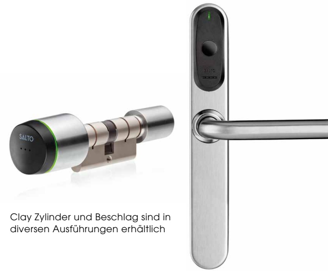
Clay Zylinder und Beschlag sind in diversen Ausführungen erhältlich

Die batteriebetriebenen elektronischen Clay Zylinder sind äußerst kompakt und durch den einfachen Austausch des Türzylinders schnell montiert. Ideal auch für Objekte, in denen es nicht möglich oder gewünscht ist, Türbeschläge anzubringen (z. B. Denkmalschutz). Für innen wie außen geeignet und mit verschiedenen Oberflächen erhältlich.