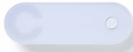
ClayIQ und Clay Repeater mit identischer Größe und Optik

Der ClayIQ verbindet als Zentrale die Clay Zylinder und Beschläge mit der Online-Plattform My-Clay.com – und das komplett kabellos und ohne Konfigurationsaufwand. Einfach den ClayIQ mit der Halterung horizontal oder vertikal an der Wand befestigen, Strom anschließen und im geschützten persönlichen My-Clay Account aktivieren. Der ClayIQ verbindet sich selbstständig über das Mobilfunknetz mit dem Internet. Die Installation ist überall dort möglich, wo ein Mobiltelefon Empfang hat. Die Entfernung zu den Clay Zylindern und Beschlägen sollte maximal 10 Meter betragen.