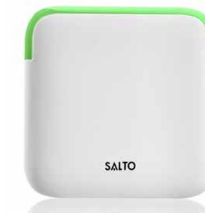
Clay Wandleser sind in den Farben Weiß und Schwarz erhältlich

Die Clay Wandleser beziehen all jene Türen in die Zutrittslösung ein, an denen kein Clay Zylinder oder Beschlag angebracht werden kann, z. B. automatische Türsysteme, Schranken oder Aufzüge etc. Für den Innen- und Außeneinsatz geeignet. Die Clay Wandleser benötigen wegen der Ansteuerung der Türen als einzige Clay Komponente eine Verkabelung.