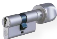
Profil-Knaufzylinder Nr. 815 UDM Messing matt vernickelt eine Seite Schließfunktion, andere Seite Alu-Knauf, F1, diverse Knaufformen erhältlich (abgebildet Form H)